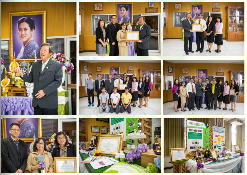
จิตานา สร้อยไพศุณ ประชาสัมพันธ์สำนักวิจัยฯ เขียนข่าว/ถ่ายภาพ